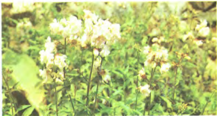
944. Мидьянка лікарська.